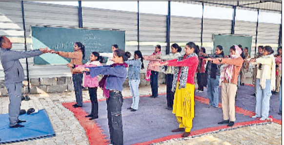
झज्जर । कार्यशाला के दौरान योगाभ्यास करती छात्राएं ।