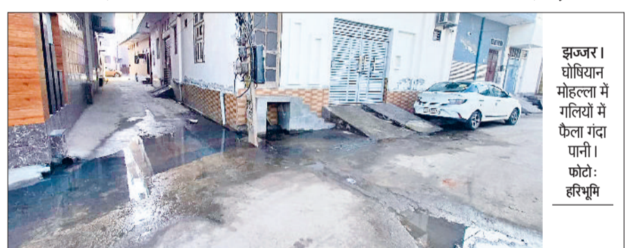
झज्जर । घोषियान मोहल्ला में गलियों में फैला गंदा पानी ।