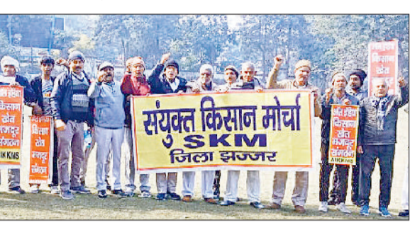
झज्जर । लघु सचिवालय परिसर में प्रदर्शन करते हुए किसान ।

संयुक्त किसान मोर्चा के आह्वान पर किसानों ने लघु सचिवालय में किया प्रदर्शन