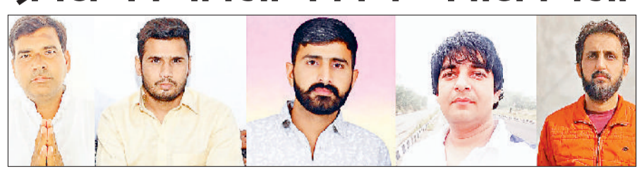
झज्जर । जेजेपी के नवनियुक्त हलकाध्यक्ष । फोटो: हरिभूमि