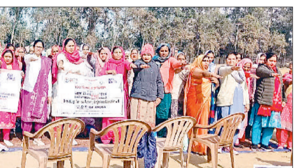
झज्जर । बाल विवाह रोकने संबंधी शपथ लेते हुए आंगनबाड़ी वर्कर्स एवं अन्य ।