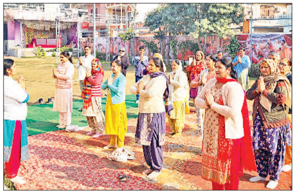
बहादुरगढ़। सूर्य नमस्कार प्रशिक्षण शिविर में अभ्यास करते साधक।

रोहताक। विदेश भेजने के नाम पर युवाओं से ठगी और उन्हें बंधक बनाए जाने का एक गंभीर मामला रोहताक से सामने आया है। रूस और यूरोप भेजने का झांसा देकर रोहताक निवासी युवक को पहले थार्लैंड और फिर म्यांमार ले जाकर बंधक बना लिया गया। इस दौरान युवक से जबरन काम कराया गया और मानसिक व शारीरिक शोषण किया गया। म्यांमार आर्मी द्वारा रेस्क्यू किए जाने के बाद युवक भारत लौटा, जिसके बाद पुलिस ने आरोपी के खिलाफ केस दर्ज कर जांच शुरू कर दी है।