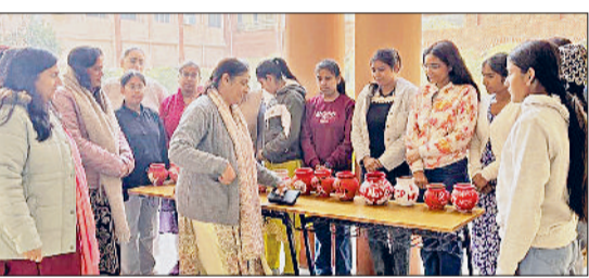
बहादुरगढ़। छात्राओं द्वारा पाँट पेंट किए गए पाँट देखती प्रिंसिपल व अन्य।