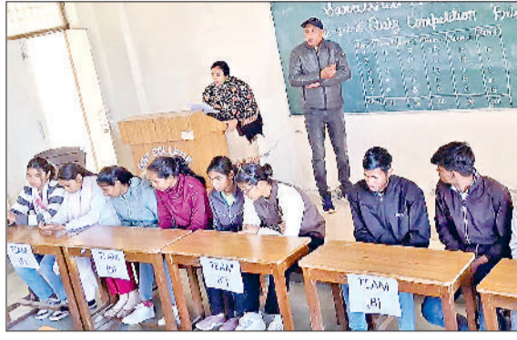
हरिभूमि न्यूज ► झज्जर । राजकीय स्नातकोत्तर नेहरू महाविद्यालय में प्रतियोगिता में भाग लेते हुए विद्यार्थी तथा प्रश्नोत्तरी प्रतियोगिता में उपस्थित विद्यार्थी एवं शिक्षक ।